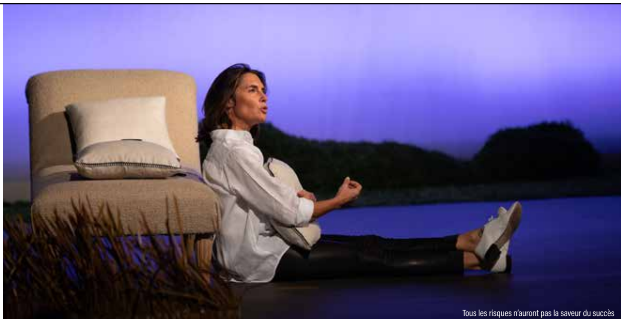
Tous les risques n'auront pas la saveur du succès