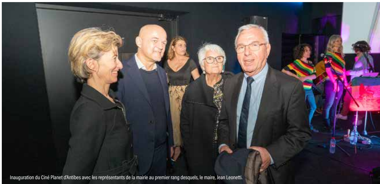
Inauguration du Ciné Planet d'Antibes avec les représentants de la mairie au premier rang desquels, le maire, Jean Leonetti.