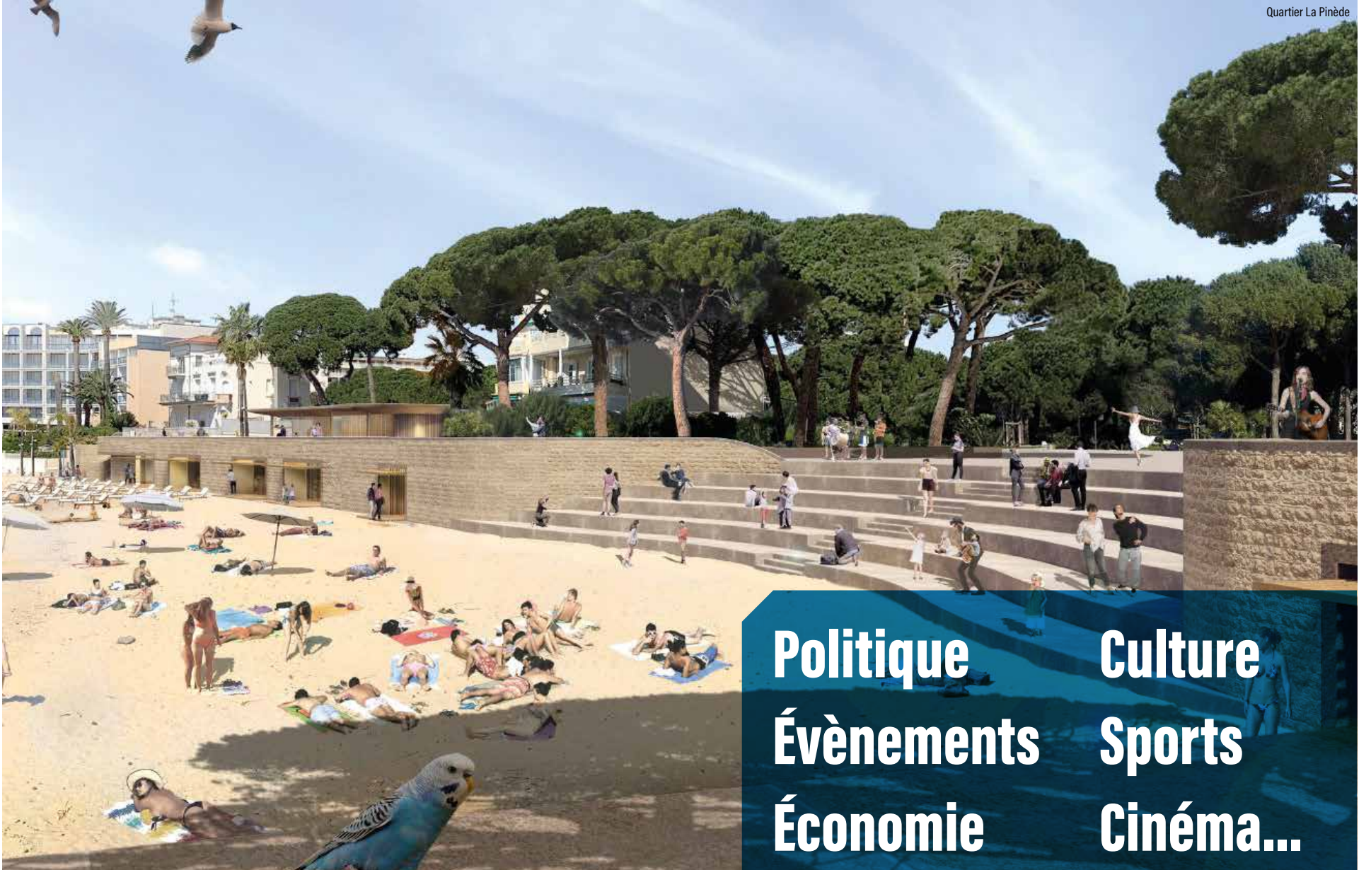
Quartier La Pinède