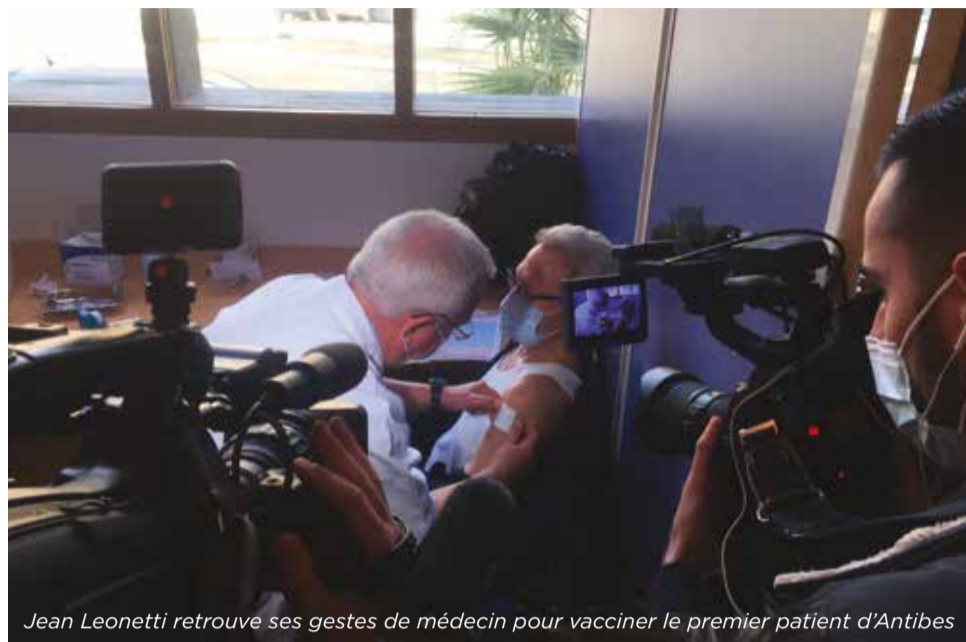
Jean Leonetti retrouve ses gestes de médecin pour vacciner le premier patient d'Antibes