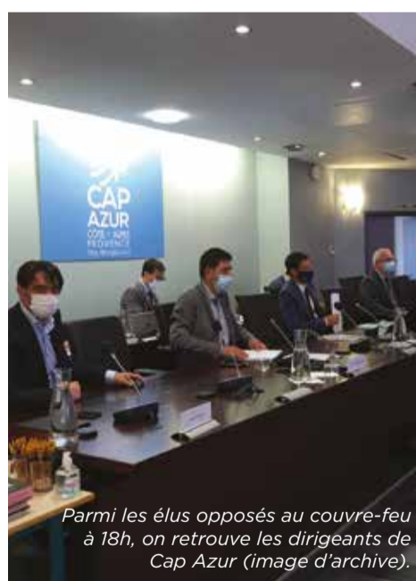
Parmi les élus opposés au couvre-feu à 18h, on retrouve les dirigeants de Cap Azur (image d'archive).

Le second sujet qui a provoqué la polémique concerne la vaccination. Parmi les contestations, on trouve le manque de vaccins disponibles pour permettre une immunisation rapide des personnes -ciblées par la campagne nationale. À la fin du mois de janvier, plusieurs centres du département étaient à l'arrêt faute de stocks de vaccins. De plus, de nombreux élus ont demandé, comme à la CASA, une meilleure organisation et une totale transparence afin d'établir une stratégie claire dans