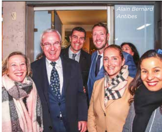
Alain Bernard Antibes

Le champion olympique de natation Alain Bernard a décidé de s'engager dans la bataille des municipales. Le sportif, âgé de 36 ans, sera présent, à Antibes, sur la liste du maire sortant Jean Leonetti. À l'instar du champion olympique de Pékin, les sportifs sont souvent courtisés par les élus politiques.